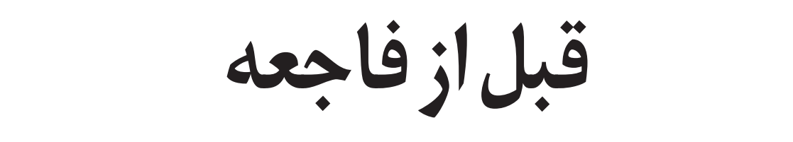
مرکز بررسی اسناد تاریخی وزارت اطلاعات، کتاب چهارم