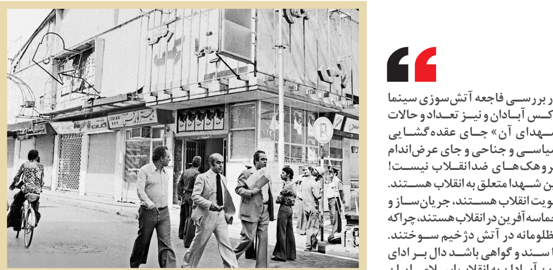
مرکز بررسی اسناد تاریخی وزارت اطلاعات، کتاب چهارم

اسناد ساواک، کتاب سوم تهران، ۱۳۷۷، صص ۳۵۳ و ۳۵۴