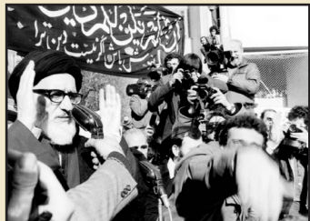
آیت‌الله سیدمحمود طالقانی در حال سخنرانی در جمع اساتید متحصن دانشگاه تهران

اثری که در معرفی آن سخن می‌رود، روایتی است از یکی از رویدادهای مغفول انقلاب اسلامی که کمتر از آن سخن رفته است. این روایت توسط یکی از اساتید حاضر در تحصن ۲۲ روزه در دانشگاه تهران در همان دوره نگاشته شده و پس از سال‌ها، به همت سیدجواد میر سلیمی به چاپ رسیده است. تدوینگر این گزارش تاریخی، داستان‌ریافتن و انتشار آن را بدین شرح روایت کرده است: «سال‌هاست که اسناد و مدارکی درباره انقلاب اسلامی جمع‌آوری می‌کنم. روزی یکی از دوستان عزیزم که می‌دانست مشغول گردآوری مطالبی درباره مجاهد مصلح حضرت آیت‌الله طالقانی هستم، مقاله‌ای برام فرستاد با عنوان ۲۲ بهمن روز تحصن دانشگاهیان و در آن به تحصن اساتید دانشگاه پرداخته و ذکر خبری هم از مجاهد و مبارز نستوه مرحوم آیت‌الله طالقانی نموده بود. مقاله را خواندم و درصدد برآمدم اطلاعات بیشتری درباره تحصن اساتید و افراد دخیل در آن پیدا کنم. در همین جست‌وجوها بود که ناگهان دست‌نوشته‌ها نه چندان خوانایی به دستم رسید که در آن به شرح ماجراها و وقایع تحصن دانشگاهیان در دانشگاه تهران پرداخته بود. جذابیت ماجرا و نیز اقدام شجاعانه و جسورانه آن اساتید بنده را به صرافت انداخت تا در جست‌وجوی پیدا کردن نویسنده آن دست‌نوشته برآم. بر سر جوامع بعد از دوندگی فراوان نویسنده جزوه را که در مؤسسه لنتنامه دهخدا مشغول کار بود یافتم. وی مردی موقر و میناسل و شاید هم کمی پیر می‌نمود. بعد از آشنایی با ایشان از انگیزه و اشتیاق قلبی‌ام نسبت به حرکت شجاعانه و انقلابی اساتدان دانشگاه در شب‌های انقلاب سخن گفتم تا تأکید کردم این نوشته جزو اسناد انقلاب اسلامی است و بهتر است چاپ شود و در اختیار همگان قرار بگیرد تا مطالعه آن مردم ایران و به‌ویژه