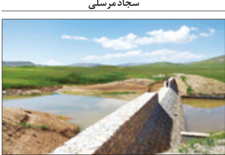
مساحت چهار محال و بختیاری یک میلیون و ۶۴۰ هزار هکتار