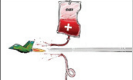
نمایشگاه بین المللی «بیمارستان منطقه جنگی بوشهر» در بو شهر گشایش یافت